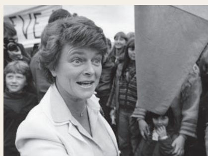
I VINDEN: Gro Harlem Brundtland var med på banke gjennom Alta-utbygginga. Her fra et besøk i Finnmark under Alta-striden.

Under Alta-saken var Arbeiderpartiets Gro Harlem Brundtland, først miljøvernminister, og fra 1981 statsminister. I ettertid skal «landsmoderen» overfor ulike medier media ha sagt at kraftutbyggingen i Alta var unødvendig.