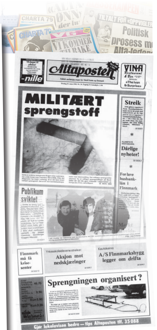
BRENNHETT STOFF: Sprenginga ved den såkalte Somby-brua var hett stoff for avisene. Her en forside fra Altaposten 23. mars 1982.