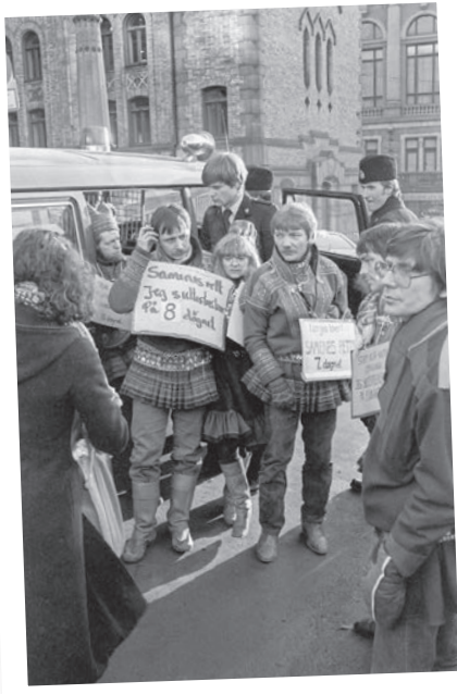
SKAPTE FURORE: De samiske ungdommene fra Finnmark skapte stor ståhei da de inntok Oslo i oktober 1979.

– Jeg gikk og la meg i stabburet hos min tante og tenkte på det vi hadde snakket om.